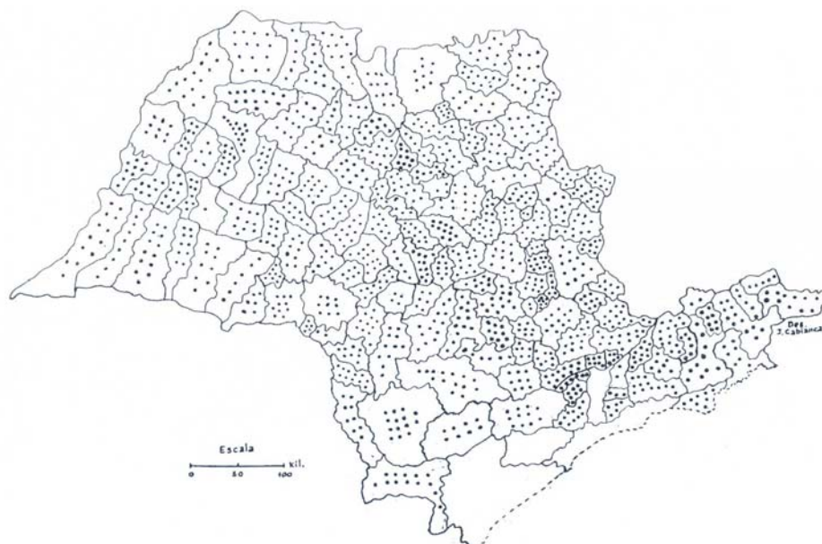
Figura 6 - Distribuição da Amostra por Regiões, cada Ponto Equivale a uma Propriedade.