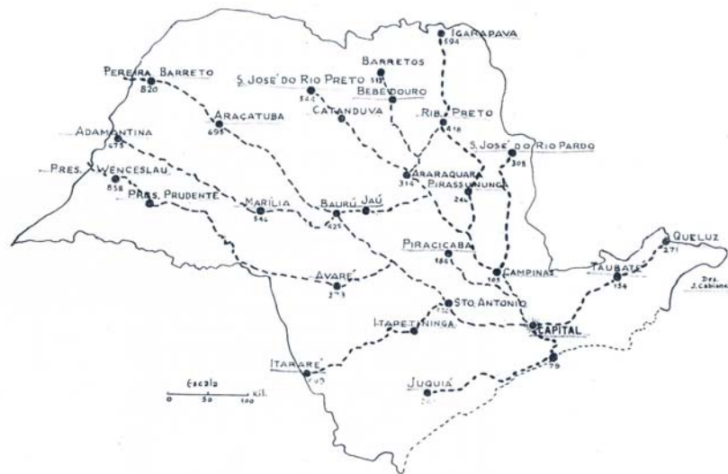
Figura 2 - Estado de São Paulo, Principais Estradas de Ferro, Distâncias da Capital em Quilômetros.