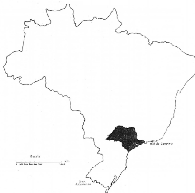
Figura 1 - O Estado de São Paulo no Interior do Brasil.

1 Foram excluídas as propriedades do Município da Capital e das Regiões Agrícolas de Miracatu, Registro e Santos.